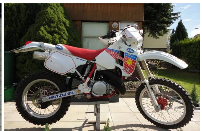
KTM 250 Bj 1991