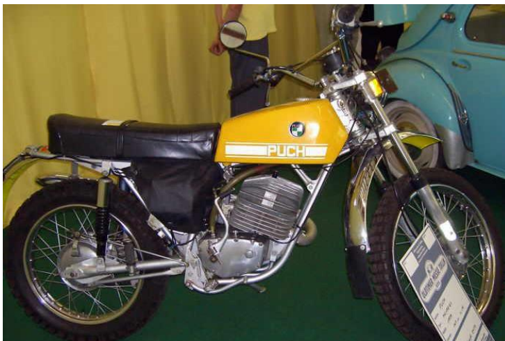
PUCH 175 Bj 1970

Wenn alte, originalgetreue Motorräder von begeisterten Fahrern bewegt werden, womöglich von demselben Fahrer der ein solches bereits vor Jahrzehnten bewegt hat, und alle diese Fahrer bei unserer Veranstaltung viele Gleichgesinnte getroffen und sich gut unterhalten haben, dann sehen wir unser Ziel erreicht.