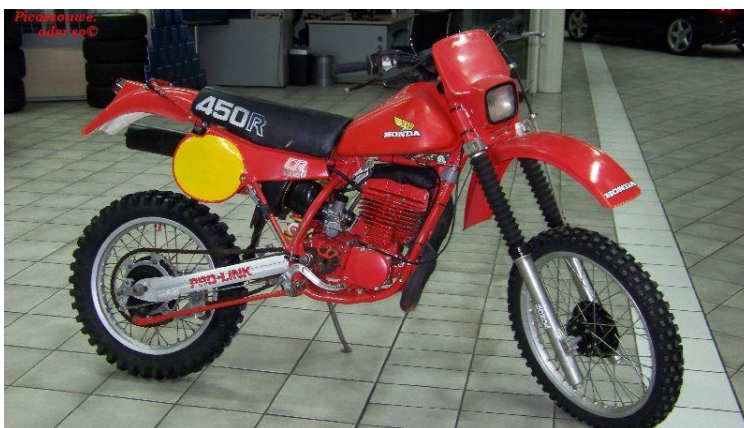
Honda 450 Bj 1981