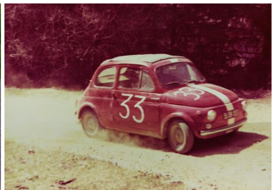
Manfred Lieskonig auf Puch 500ccm, NWF 1963