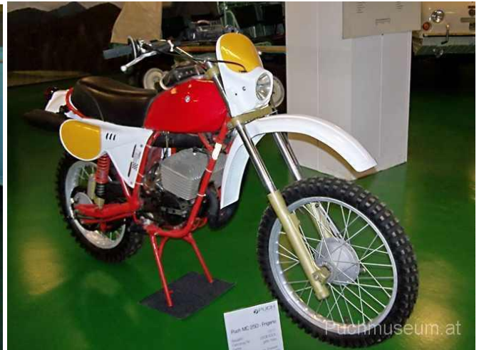
PUCH 250 Bj 1977